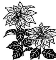
クリスマスの鉢植え